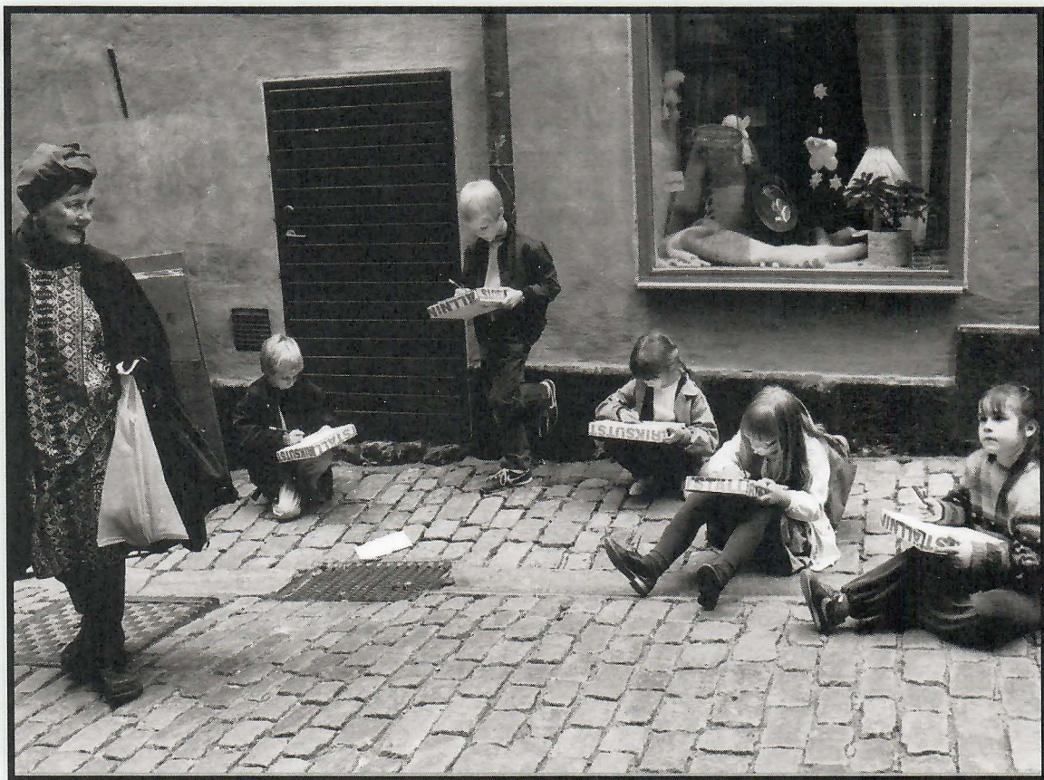
Tecknande barn i Gamla stan, 1980-talet.